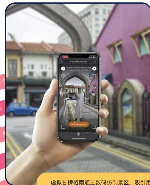
虚拟甘榜南通过数码仿制景区，吸引用户探索历史气息浓厚的甘榜格南区。