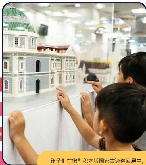
孩子们在微型积木版国家古迹巡回展中，欣赏积木拼出的新加坡国家博物馆模型。