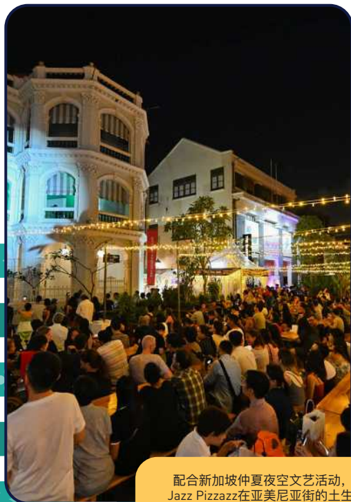
配合新加坡仲夏夜空文艺活动，Jazz Pizzazz在亚美尼亚街的土生文化馆呈献表演。